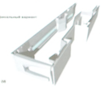
08 Транспортировка мебели. 09 Салон красоты AIDA. Фрагмент фасада. 10 Интерьер салона красоты AIDA по параметру с акцентированными функциями.